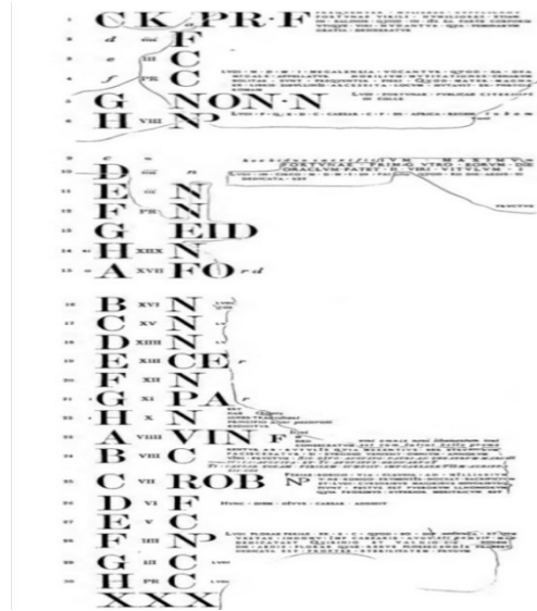
شكل رقم (4)

شهر ابريل من تقويم براينيسيني الذي يعد اكبر تقويم تم العثور عليه