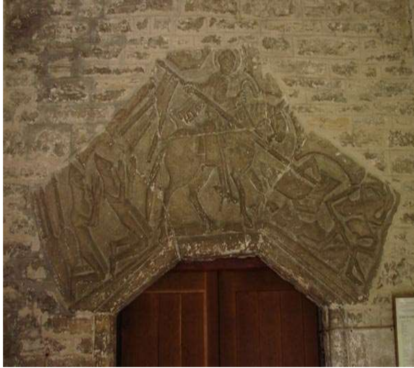
شكل(6) القديس جورج فوق المدخل الجنوبي لكنيسة فوردنجتون – دورست

( Keyser, 1904, p.Ixxviii; Nepean, 1883, (انظر شكل6) pp.333 – 334 ; Lapina, 2017, p.54; Morgan, 2006, pp.78 – 79.)