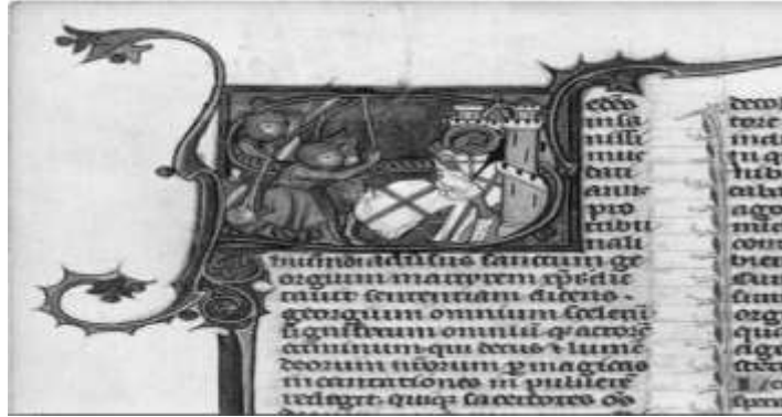
شكل (2) مخطوطة كتاب الأدب للملك فيليب الرابع

وهناك أيضاً مخطوطة "مرآة التاريخ Spiegel Historiael" لجاكوب فان ميرلاننت Jacob van Maerlant's حيث تظهر الزخرفة الأخيرة من المخطوطة مشهد استيلاء الصليبيين على القدس، ويظهر الفرسان وهم يقتحمون المدينة من جميع الجهات ويقف على اليسار مجموعة من الفرسان وهم يشاهدون الحدث برئاسة القديس جورج الذي يحمل سيفاً في يده اليمنى، وترساً أبيضاً عليه صليب أحمر في يده اليسرى (انظر شكل3). (Lapina, 2017, pp.60-61; Meuwese, 2005, p.145. )