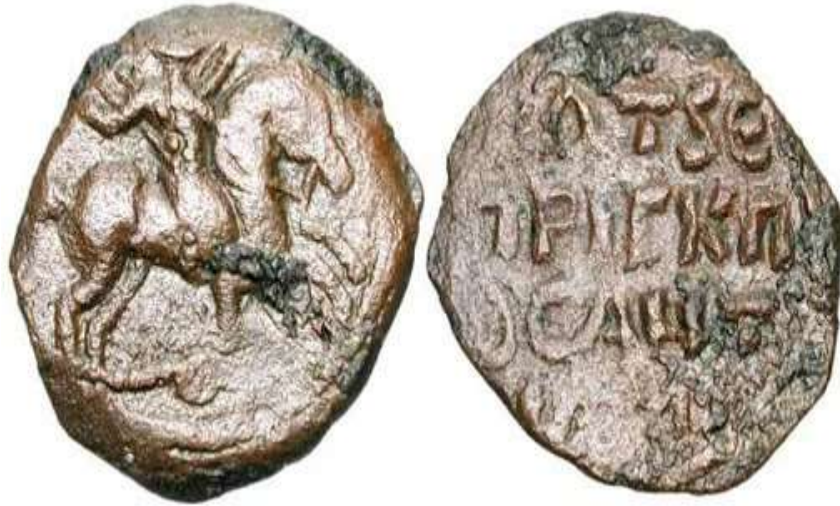
شكل (4) ظهور القديس جورج على عملة معدنية في عهد روجر دي سالرنو

وقد ترك هذا الحدث التاريخي انطبعا قويا لدى الصليبيين، إذ لا بد أنه كان وراء ظهور صورة القديس جورج على عملة معدنية في عهد روجر دي سالرنو أمير أنطاكية (1112 – 1119م) أي بعد مرور أقل من عقدين على تأسيس هذه الإمارة (انظر شكل4). (Porteous, 1989, p.367; Immerzeel, 2004, p.40; Badamo, 2011, p. 203; Bianchi, 2011, p.94.)