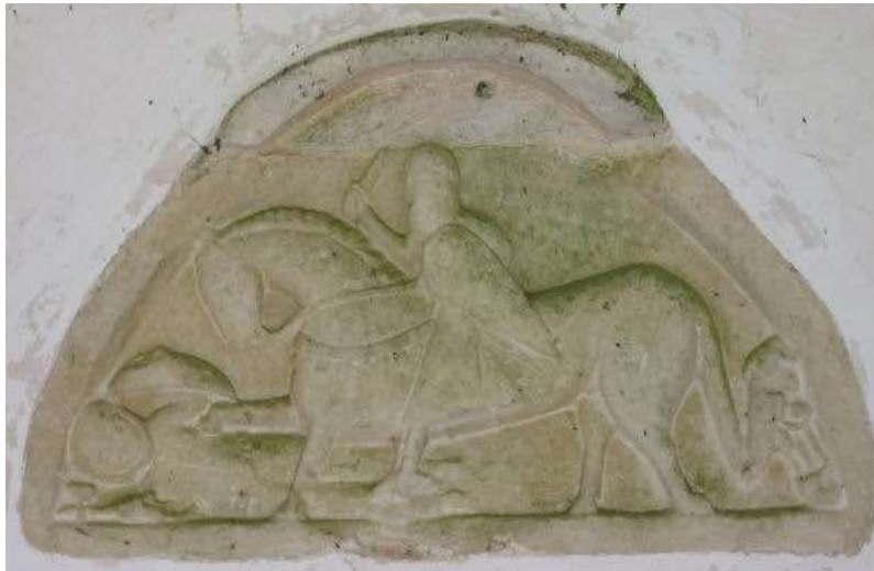
شكل (8) القديس جورج في كنيسة دامرهام – هامبشاير

كذلك تم العثور على تمثيل مماثل في كنيسة دامرهام Damerham في هامبشاير، والتي تُصور دورا مماثلا لما عكسه كل من هاردهام وفورددينجتون (انظر شكل8). (Good, 2009, p.36; Morgan, ) 2006, p.84; Myers,1933, p.36; Lapina, 2017, pp.54 – 55.)