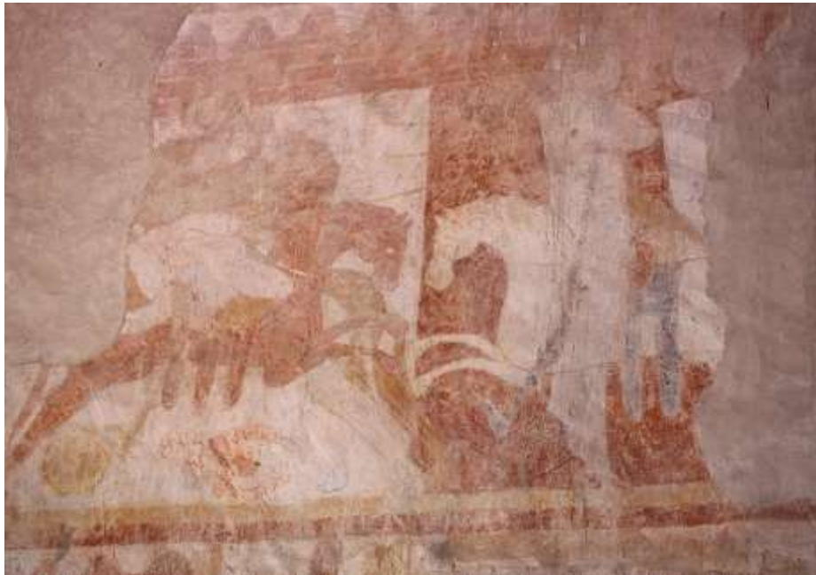
شكل (5) القديسون المحاربون على جدارية كنيسة القديس جوليان في بونسي على نهر اللوار

والمسلمين، وأحد المسلمين – الذي تم تحديده من خلال درعه المستدير – يرقد جريحا أو ميتا على الأرض، بينما يمثل المشهد الثاني ظهور ثلاثة قديسين يرتدون ملابس بيضاء ويمتطون خيولا بيضاء وتوجد هالة فوق رؤوسهم، والتي تحددهم كقديسين، وقد تم تصويرهم على خلفية مظلمة وذلك لجعل خيولهم ودروعهم البيضاء بارزة، كما صوروا المسلمين وهم يديرون خيولهم ويقومون بالفرار، وبالرغم من أن المشهد الثالث غير واضح فإن الفرضية الأكثر ترجيحاً أنه يمثل الصليبيين المنتصرين (انظر شكل 5). (Lapina, 2009.B, pp.137 – 157; Yves, 2009, pp.376 – 377; Deschamps, 1947, pp.460-461; Deschamps, 1950, pp.115 – 116; Morris, 2016, p.204; Luchitskaya, 2003, p.89.)