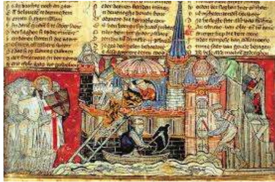
شكل (3) مخطوطة مرآة التاريخ لجاكوب فان ميرلاننت

ولا عجب أن الفرسان الأوروبيين بعد معرفتهم بكون القديس جورج قديساً محارباً في العقود التي سبقت عام 1095م، وانبهارهم من شفاعته لهم أثناء حملاتهم على الشرق الإسلامي، كان من الضروري أن ينال تقديراً مناسباً يفوق تقديرهم للقديسين المحاربين الآخرين.