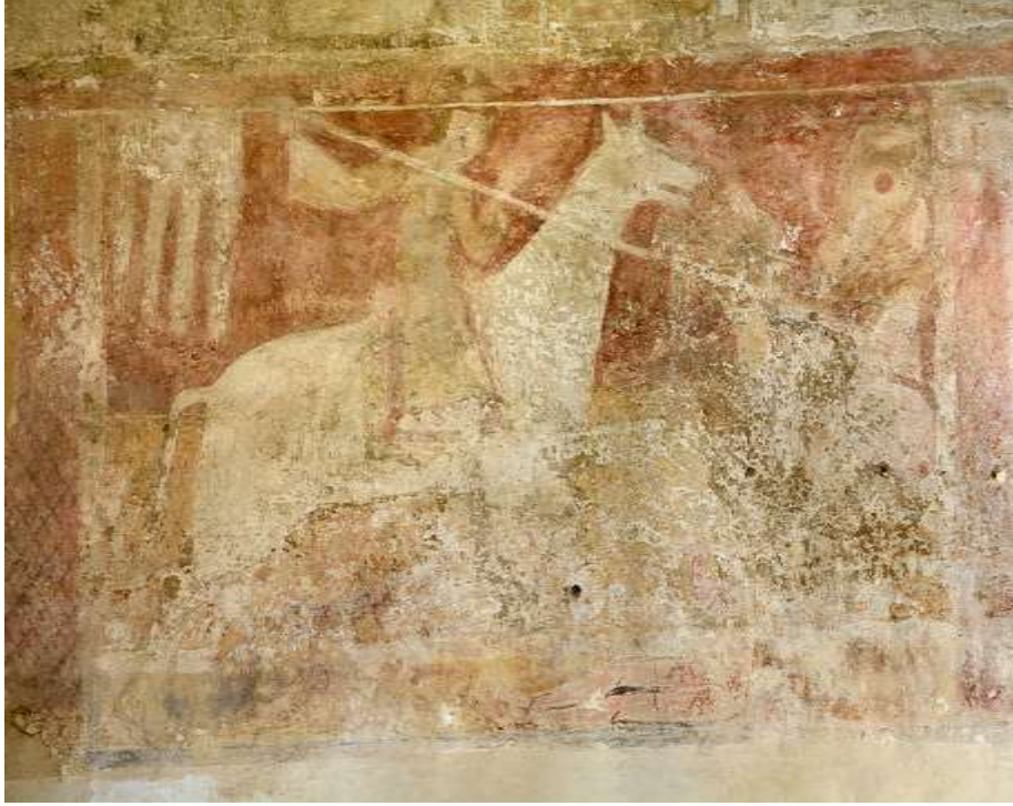
شكل (7) القديس جورج في كنيسة هاردهام – ساسكس

كذلك تم العثور على تمثيل مماثل في كنيسة دامرهام Damerham في هامبشاير، والتي تُصور دورا مماثلا لما عكسه كل من هاردهام وفورددينجتون (انظر شكل8). (Good, 2009, p.36; Morgan, ) 2006, p.84; Myers,1933, p.36; Lapina, 2017, pp.54 – 55.)