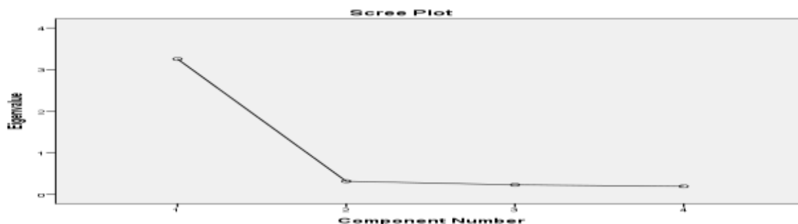
شكل (3) مخطط الانتشار لمقياس التوافق الزوجي

الزوجية). وبذلك يتضح أن مقياس التوافق الزوجي يتمتع بالصدق العالمي. كما تظهر هذه الابعاد في مخطط الانتشار الظاهر في الشكل التالي: