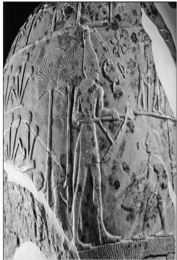
(شكل رقم ١)