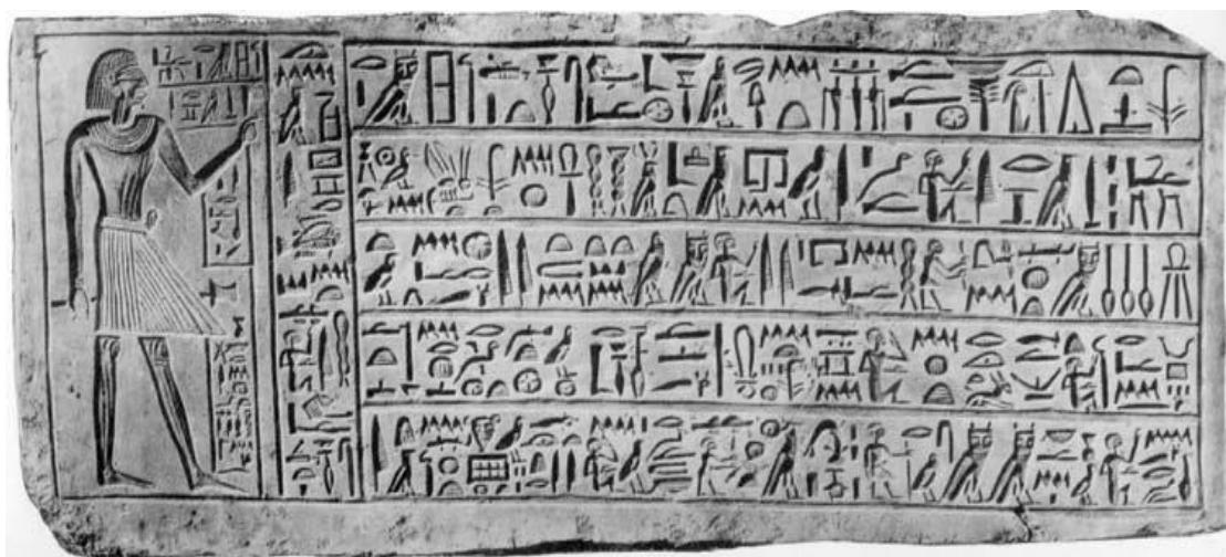
(شكل رقم ٣)

لوحة جدارية من مقابر الأسرة الحادية عشرة عليها نقوش عن حرب شنها ملك طيبة أنتيف الثاني ضد